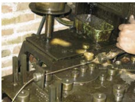
Sølvet trekkes til tråd.