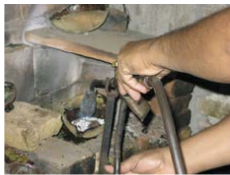
Legeringen 925 lages på verkstedet av kobber og fint sølv.