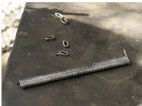
Riglen sages opp til øsken.